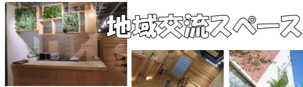
地域交流スペース