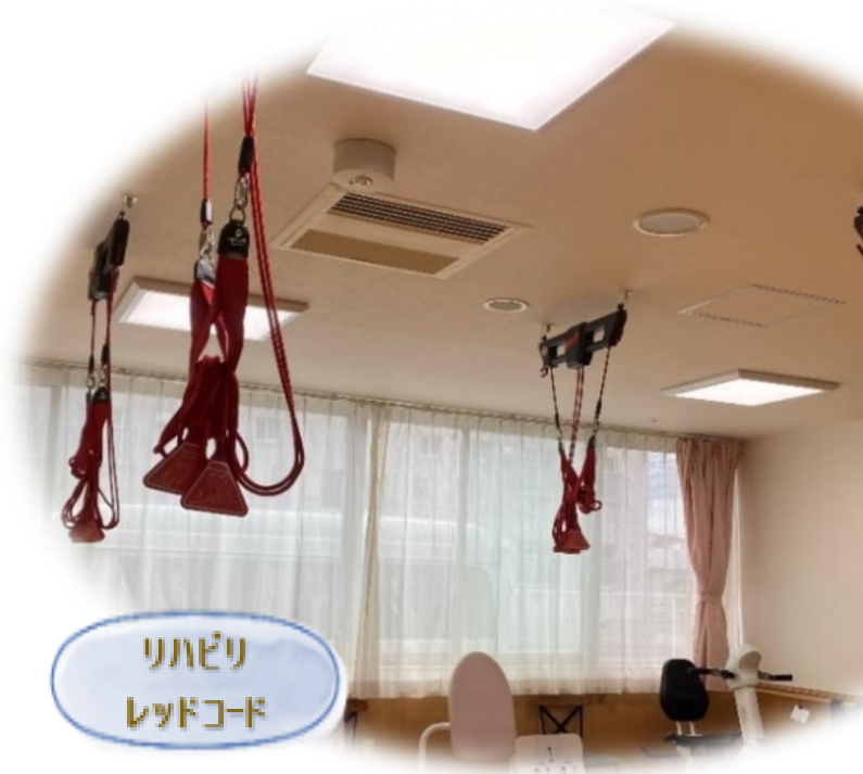
リハビリ レッドコード