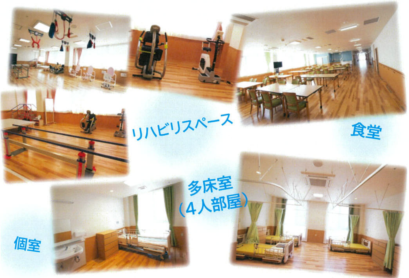
リハビリスペース

外部より床屋さんに来ていただいております。ご希望の方は職員までお申込みください。